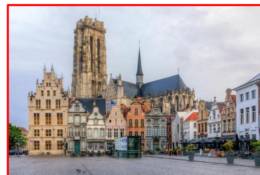
IMAGEN DE LA CIUDAD